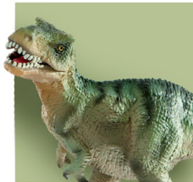
PANTONE® 7493 U